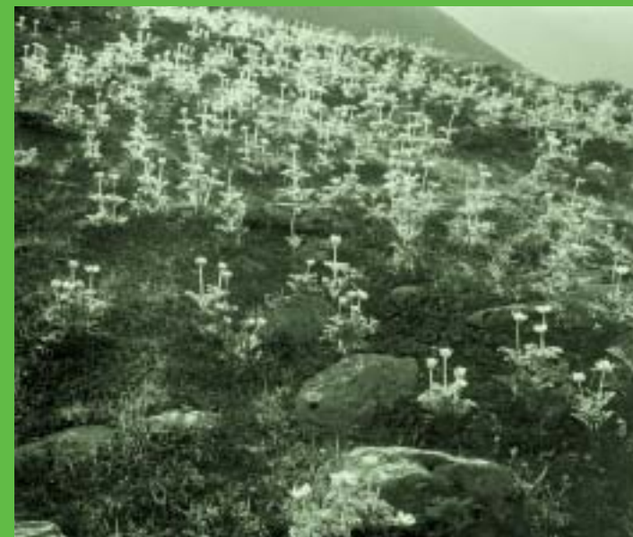
Blumen aus der Dokumentation des Schweizerischen Bun- des für Naturschutz